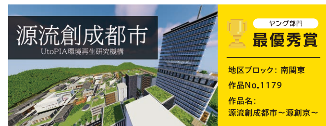
UtoPIA(ユートピア)広報部 UtoPIA kohobu

この大会はテーマについて考えたことを自由に表現できる素敵な大会でとても楽しく活動できました。私たちの考えるこの大会で1番大切なことは「楽しむこと」です。どんなときも全力で楽しめば必ず素晴らしい作品ができます！